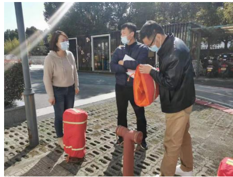
抽查新馨花园幼儿园